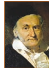
C. F. GAUSS