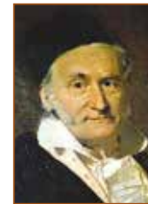
C. F. GAUSS