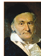
C. F. GAUSS